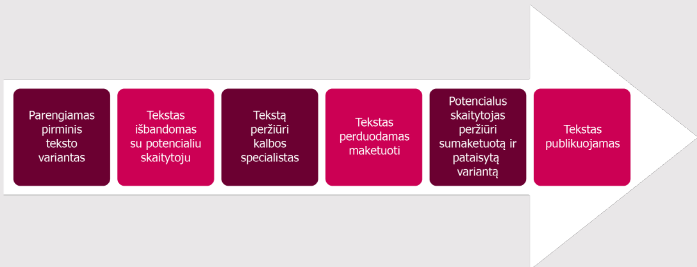
2 schema. Teksto lengvai suprantama kalba parengimo procesas

Svarbu atkreipti dėmesį į tai, kad viso proceso metu tekstas yra koreguojamas. Išbandžius pirmą teksto variantą su potencialiu skaitytoju, tekstas yra pakoreguojamas ir perduodamas kalbos specialistui. Peržiūrėjus kalbos specialistui, tekstas dar kartą pakoreguojamas ir vėl išbandomas su potencialiu skaitytoju. Pakartotinai išbandžius potencialiam skaitytojui, tekstas dar kartą pakoreguojamas ir publikuojamas.