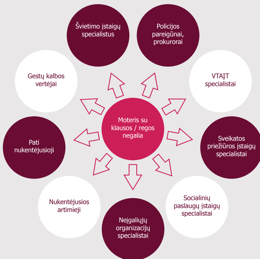
1 schema. Galimi informacijos apie smurtą artimoje aplinkoje patyrusią moterį su klausos / regos negalia šaltiniai

Pagrindiniai informacijos šaltiniai, iš kurių SKPC gali gauti pranešimą apie smurtą artimoje aplinkoje patyrusią moterį, turinčią klausos ar regos negalią, pavaizduoti žemiau esančioje schemoje.